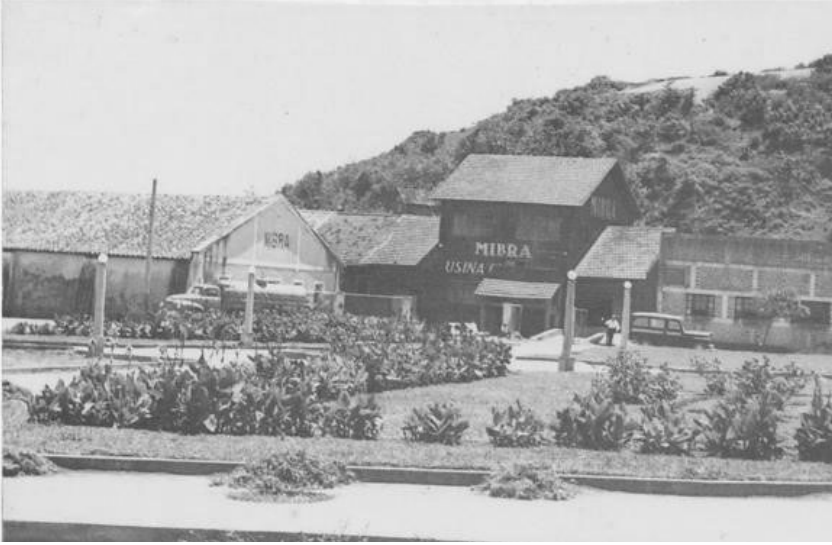
Jardim Público: Usina Mibra: Guarapari, ES [19--].