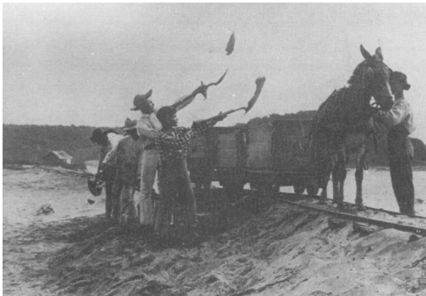
Extração e transporte de areia monazítica de Guarapari no início do século XX.

Na década de 1940, o soviético Boris Davidovitch adquiriu a Société Minière Industrielle Franco-Brasilienne e a transformou na Monazita Ilmenita do Brasil (Mibra), principal explorada e exportadora das jazidas de areias monazíticas, cujo depósito se encontrava ao lado do antigo porto (canal de Guarapari), de onde se exportavam o produto. Na imagem seguinte é possível visualizar a sede da usina Mibra. A fama curativa das areias contribuiu para que Guarapari descobrisse uma vocação: o turismo. Atualmente, Guarapari figura entre os principais destinos turísticos nacionais, atraindo milhares de pessoas do Brasil e do mundo, que tem a oportunidade de desfrutar de sua natureza exuberante, entre o mar e as montanhas, com belas praias, baías, manguezais, ilhas, cachoeiras e restingas.