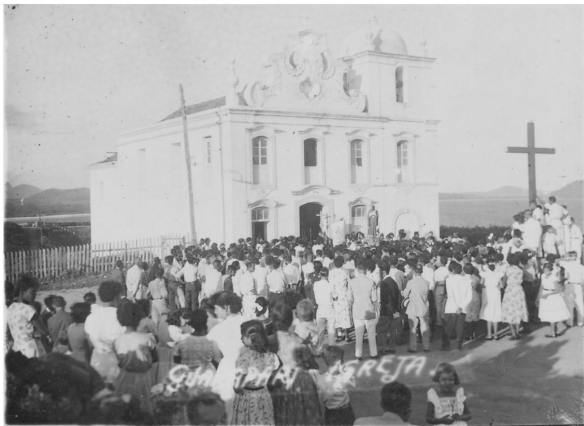
Igreja Matriz Nossa Senhora da Conceição: Guarapari, ES [19--].

Com efeito, em 1585, José de Anchieta fundou uma pequena capela e residência para os padres em missão no alto de uma colina, sob a invocação inicial de Santana e, depois, tornou-se a matriz de Nossa Senhora da Conceição. Neste período, a aldeia ficou conhecida como Vila dos Jesuítas sendo a data considerada o marco da fundação de Guarapari. No ponto central do povoado, era em torno da igreja que o cotidiano da população era tecido, marcado por rituais religiosos, festivos e políticos. Na imagem seguinte, pode-se visualizar o estado da referida matriz nas primeiras décadas do século XX e, a considerar a presença de grande número de pessoas, sua importância na sociabilidade local. Em 1970, o edifício foi tombado como patrimônio nacional pelo Instituto do Patrimônio Histórico e Artístico Nacional (IPHAN) e, atualmente, se encontra aberto à visitação.